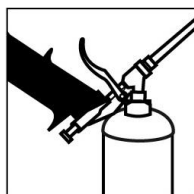
Ghiera per pulizia pistola Attachment for gun cleaning